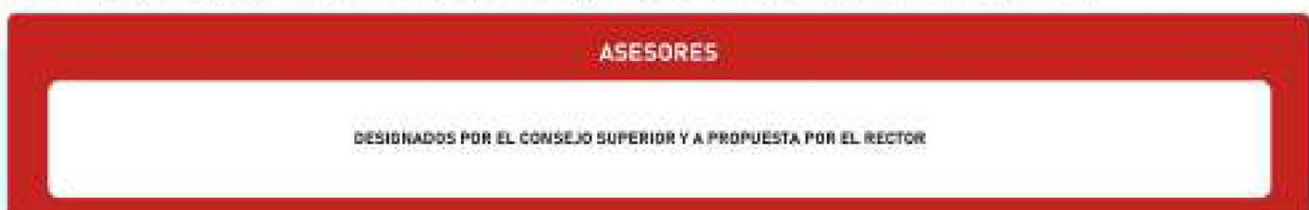
FIG. 4: CONTINUACIÓN Y FINAL DISEÑO ESTRUCTURAL DEL IURP ART. 9.

Por último el área de asesores que se desprende del artículo 9° del Estatuto que hemos citado con anterioridad en el presente apartado. Ver figura 4