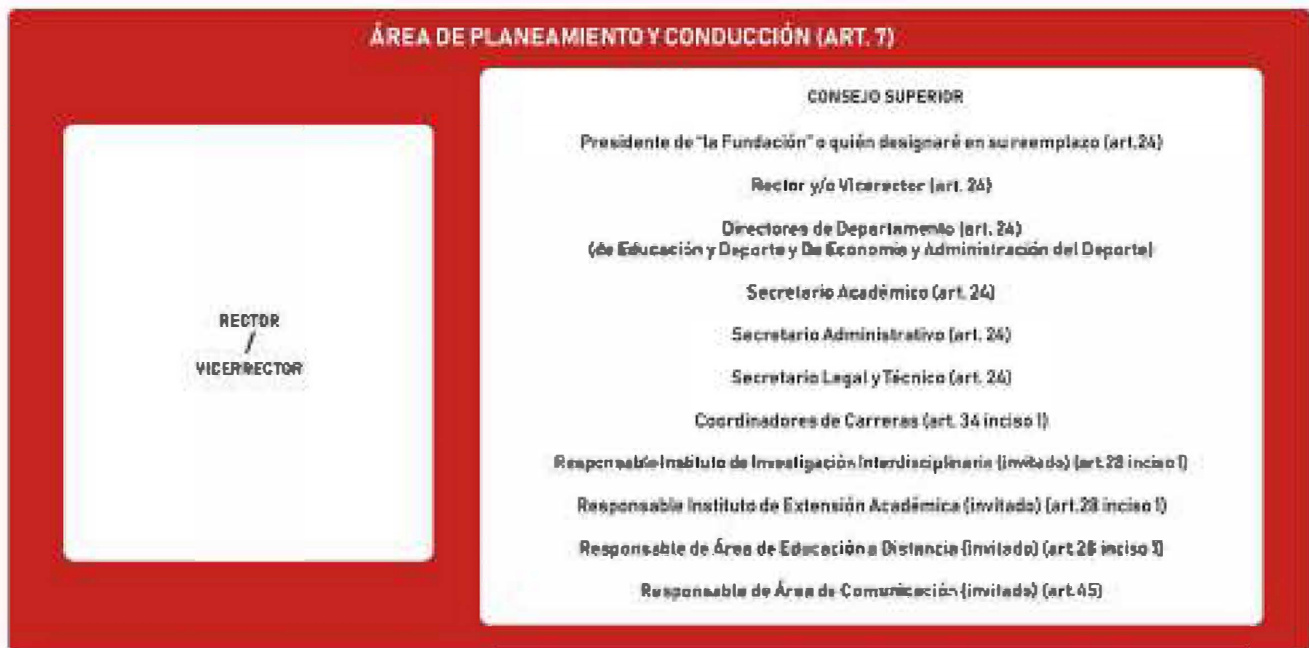
FIG. 2: CONTINUACIÓN DISEÑO ESTRUCTURAL DEL IURP ART. 7.

El área de la tecnoestructura conformada por las secretarías actualmente son tres, los coordinadores de carreras que son cuatro, los responsables del Instituto de Investigación Interdisciplinaria y de la oficina de coordinación Institucional; y que en el Estatuto deviene de su artículo 8°. Ver figura 3