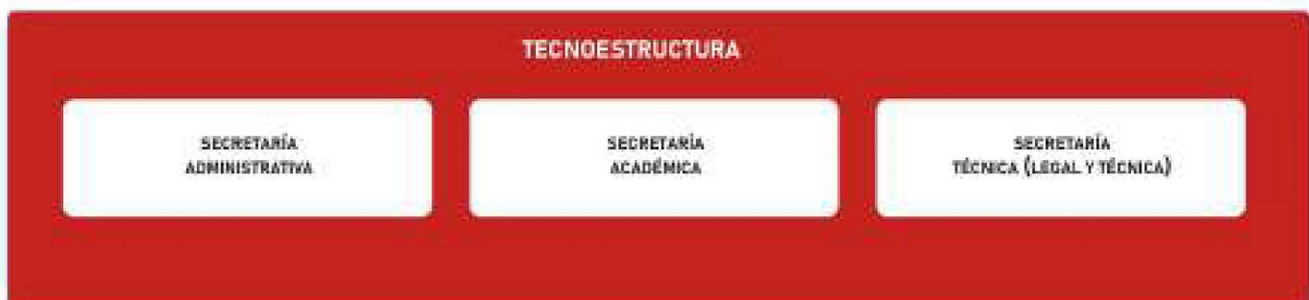
FIG. 3: CONTINUACIÓN DISEÑO ESTRUCTURAL DEL IURP ART. 8.

El área de la tecnoestructura conformada por las secretarías actualmente son tres, los coordinadores de carreras que son cuatro, los responsables del Instituto de Investigación Interdisciplinaria y de la oficina de coordinación Institucional; y que en el Estatuto deviene de su artículo 8°. Ver figura 3