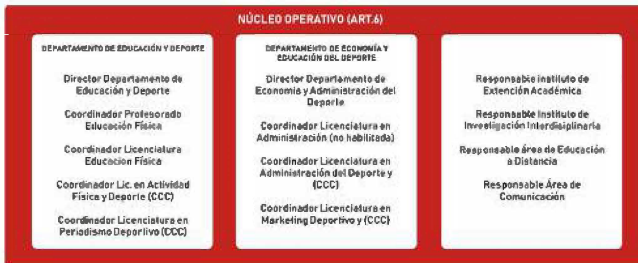
FIG. 1: DISEÑO ESTRUCTURAL DEL IURP ART. 6.

Las áreas que quedaron definidas son: el núcleo operativo conformado por los departamentos, los institutos y las áreas que en la actualidad son dos en cada uno de ellos; y que en el Estatuto deviene de su artículo 6°. Ver figura 1