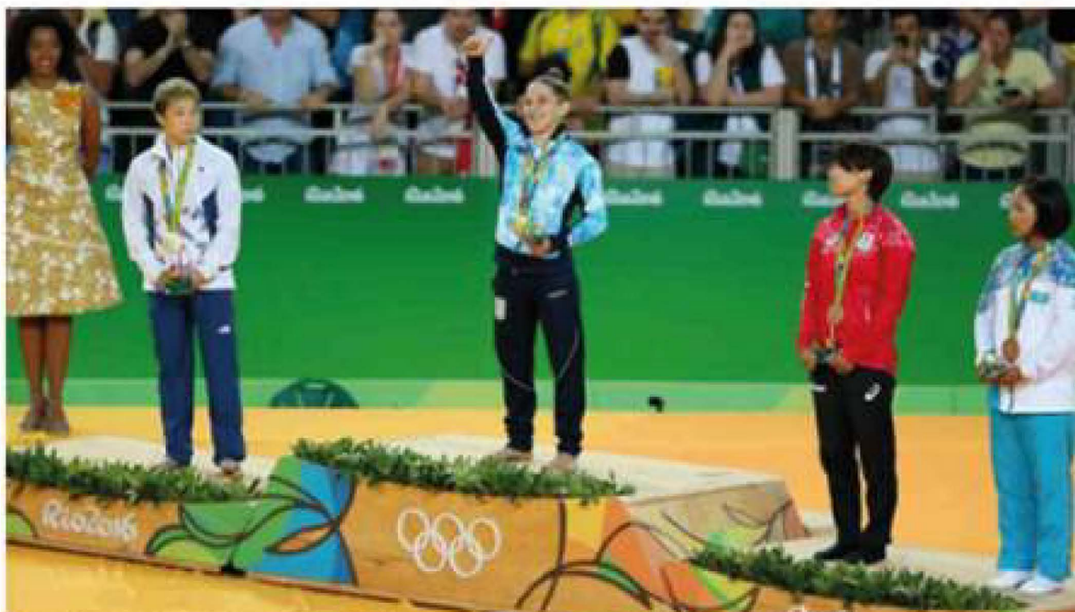
FIGURA 2. LA JUDOKA PAULA PARETO RECIBIENDO SU MEDALLA DE ORO EN LOS JUEGOS OLÍMPICOS DE RIO 2016.

Los deportistas de alto rendimiento son productos de un proceso de formación que se inicia a temprana edad. Generalmente las escuelas de iniciación deportiva utilizan como recurso para motivar y estimular a los niños y niñas la entrega de premios de modo regular.